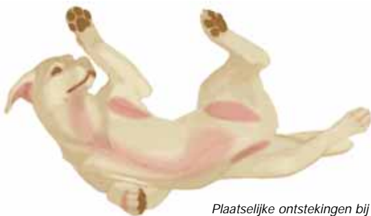
Plaatselijke ontstekingen bij atopie