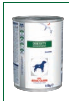
Blikvoeding van 410g